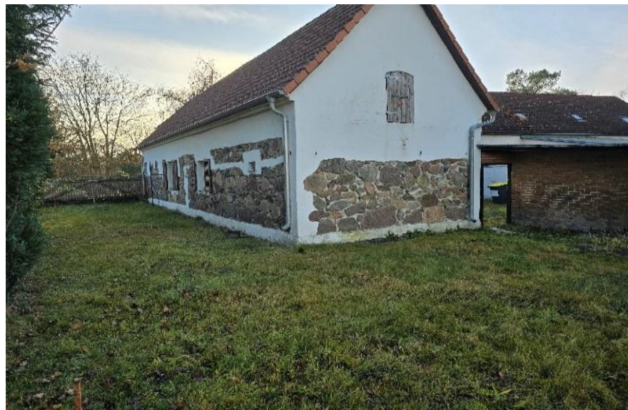
Blick vom Garten zur Stallung