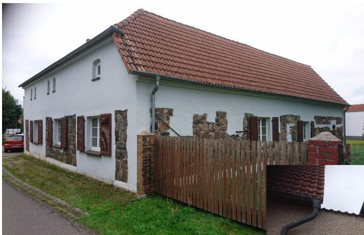
Straßenseite und Hofeinfahrt