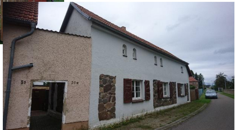
Straßenseite mit Blick nach Osten